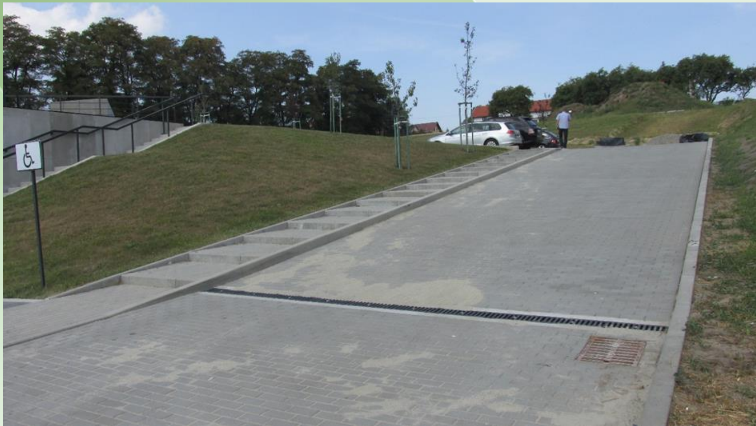
Gmina zrealizowała dojazd.