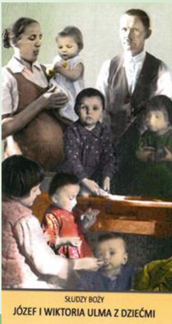
SŁUDZY BOŻY JÓZEF I WIKTORIA ULMA Z DZIEĆMI