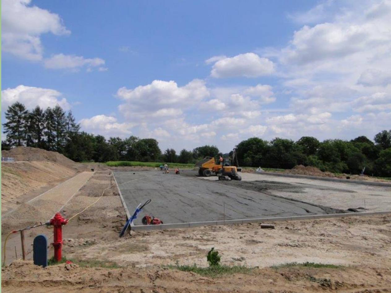
Parking przewidziany został dla Muzeum Ulmów i Gminnego Centrum Kultury